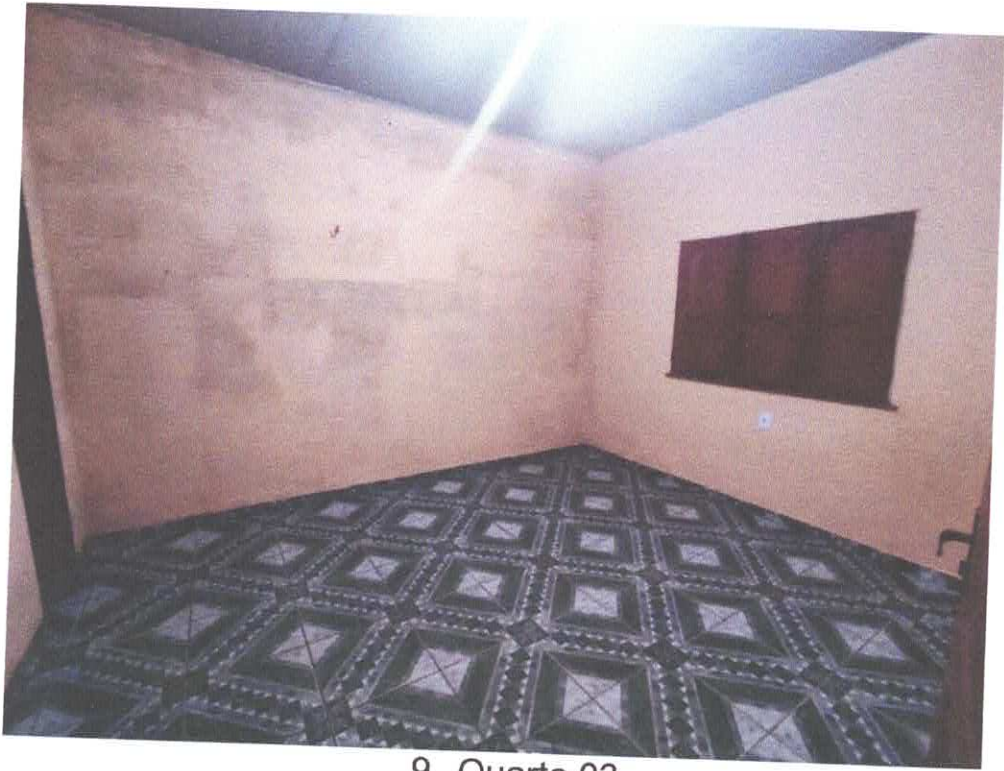
9. Quarto 03