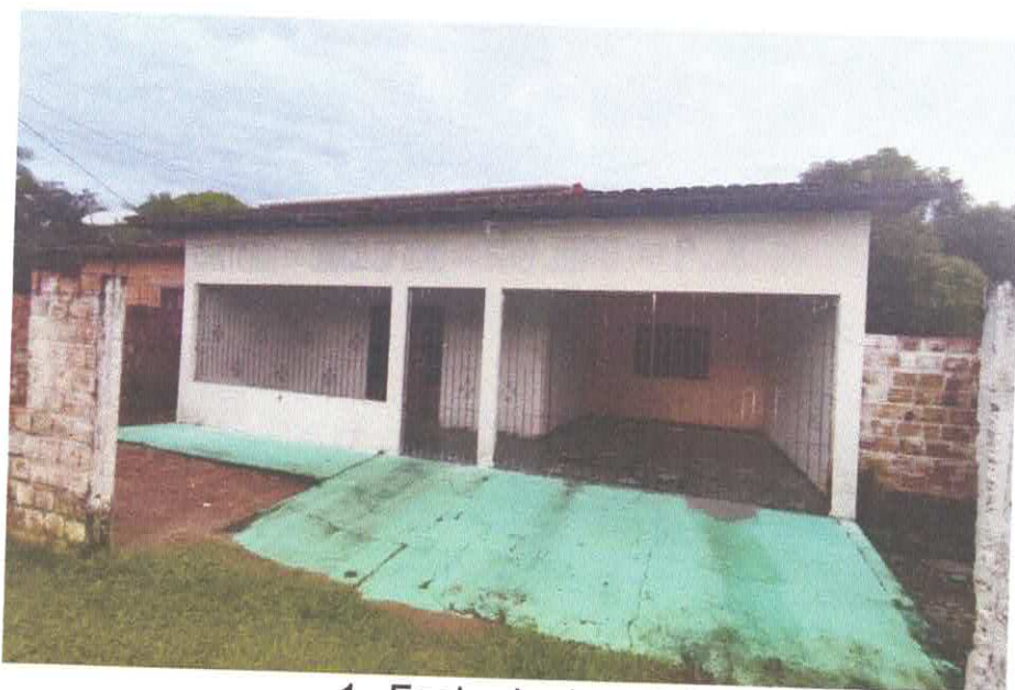
1. Fachada do prédio