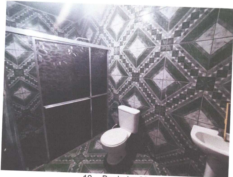
10. Banheiro 02