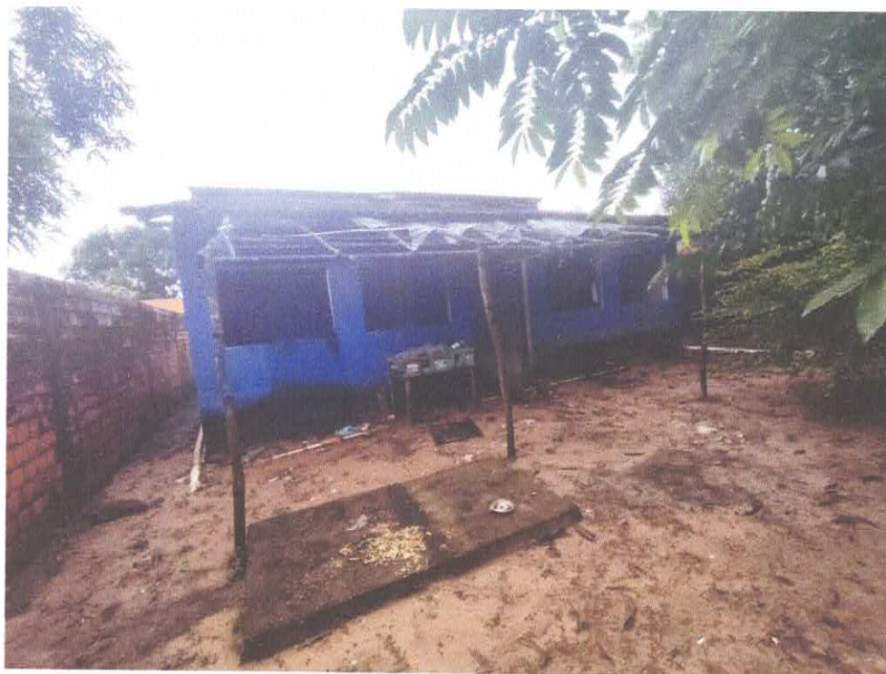
15. Vista Posterior do Prédio