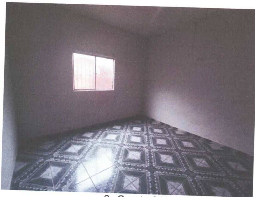
6. Quarto 01