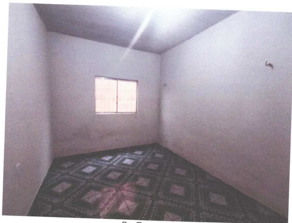
8. Quarto 02