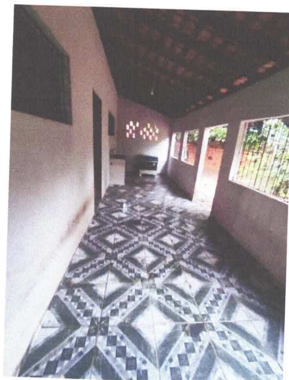
13. Área de serviço coberta