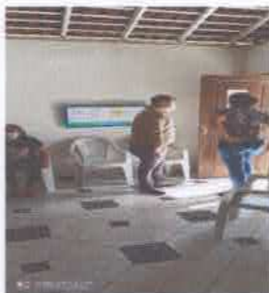
SALA DE VISITA